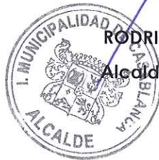
RODRIGO MARTINEZ ROCA Alcalde de Casablanca